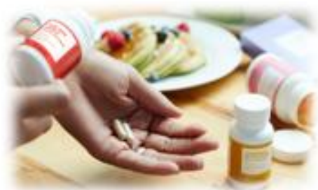
Assunzione di farmaci