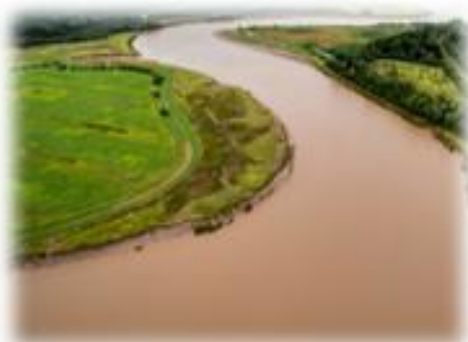
Immissione farmaci nel corpo idrico ricettore