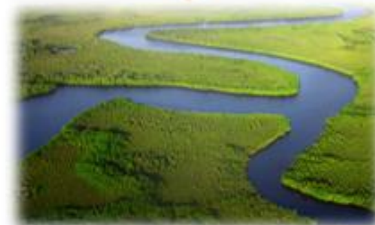
Assenza di farmaci