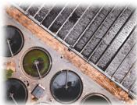
Impianti di trattamento convenzionali